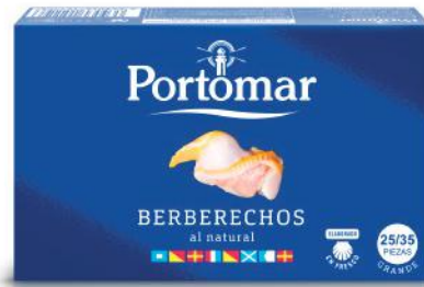
Coques au naturel