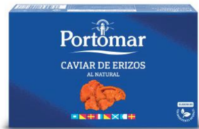
Caviar d'hérisson au naturel