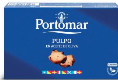
Poulpe à l'huile d'olive