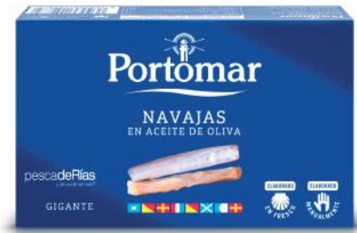
Couteaux à l'huile d'olive