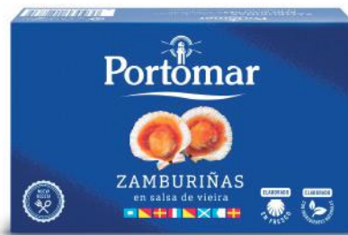
Pétoncles à la sauce de vieira