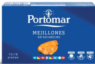
Moules à l'escabèche frit

Artisanat, qualité et tradition sont les paramètres qui définissent nos produits. Une belle sélection faite avec amour, de la mer à votre table.