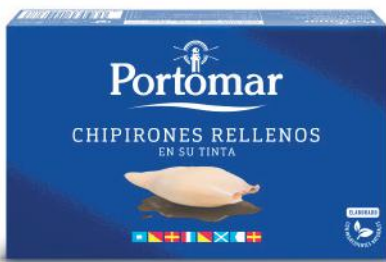
Calmars farcis à l'encre